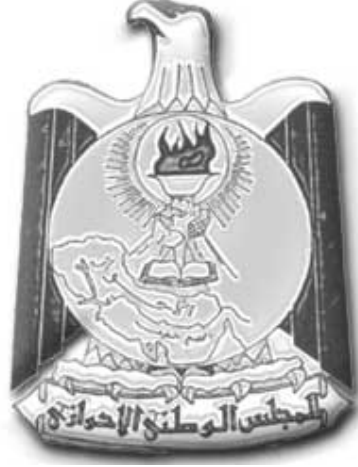
شعار المجلس الوطني الأحوازي

كما أقر المؤتمر التأسيسي للمجلس الوطني الأحوازي شعار الأحواز اثناء مرحلة النضال من اجل تحرير الأحواز ، وفور تحرير الأحواز سوف يقرر المجلس الوطني الأحوازي اجراء انتخابات وطنية عامة يشارك فيها كل الشعب العربي الأحوازي لانتخاب اعضاءه في المجلس الوطني ، وستكون من ضمن مهمات المجلس بعد التحرير دراسة وتشريع قوانين خاصة بالاحواز من ضمنها شعار الأحواز ، كما اقر المجلس الوطني شعاره للأحواز اثناء مرحلة النضال والثورة على النحو التالي: